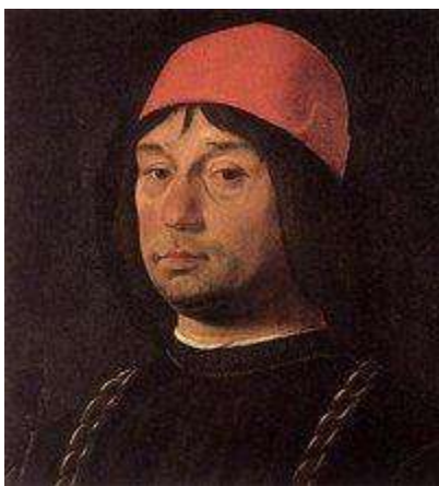
Giovanni II Bentivoglio

Papa Eugenio IV entra a Bologna e vi rimane per tutto il tempo in cui hanno luogo le trattative per il Concilio di Ferrara: i bolognesi, salassati dalle tasse pontificie imposte con la scusa delle alte spese conciliari, guidati dagli amici dei Bentivoglio, nella notte del 21 maggio 1438 prendono le armi e aprono le porte a Niccolò Piccinino , capitano dei Visconti in guerra contro la Chiesa.