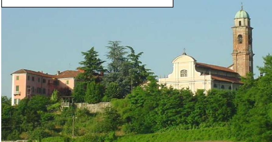
PALAZZO TROTTI E PARROCCHIA

dell'immunità contro qualunque ulteriore ignominia; sempre che fossero trascorsi almeno tre giorni dall'inizio del gioco, allorché la marmaglia aveva diritto di rinnovare la scena. Purtroppo, questa sorta di gioco toccava solamente donne di bassa condizione economica che, per evitare di perdere una parte di