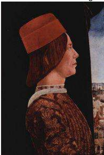
Giovanni II Bentivoglio, ritratto di Ercole de Roberti

Aiutandoci ancora una volta con Wikipedia , l'Enciclopedia libera di Internet, andiamo a scoprire le origini e la storia della Famiglia Bentivoglio. I Bentivoglio (in latino Bentivolius ) furono una famiglia feudale insediatasi a Bologna nel XIV secolo che vantava ascendenze da Re Enzo di Sardegna. Fra